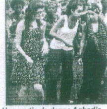
Une partie de danse Agbadja

thème est 'Education pour tous'. La seule difficulté que nous avons rencontré au départ était liée à la langue et à l'accent mais avec l'aide du Directeur de l'école tout s'est bien passé et me réjouit » a-t-elle conclut.