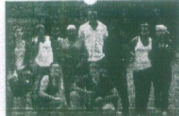
Visite des volontaires à la cascade de Kpimé