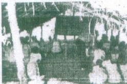
Les volontaires en plein cours à Togopémé